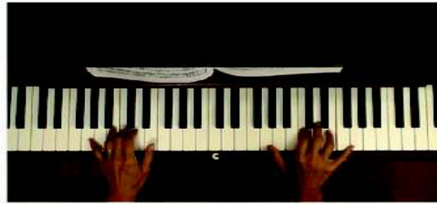
Clementi Sonatina Op. 36, No. 1 1st mvt Spiritoso Tutorial (at tempo, then slow) 184,900 views · Jul 15, 2010