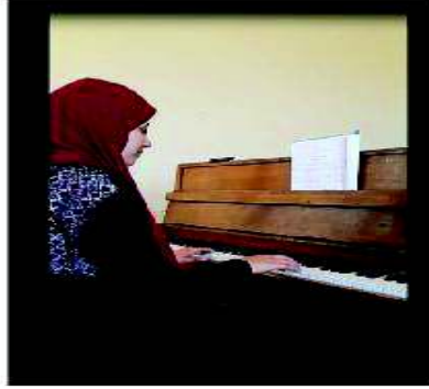
شكل رقم (٧) تجاز الطالب