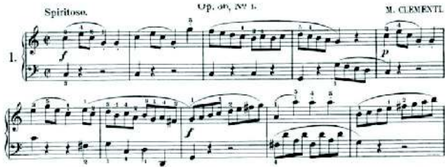
شكل رقم (٥) ما تم اتجازه من قبل الطالب

- قامت الباحثة بتسميع ما كلف به الطالب وقد فوجئت الباحثة بان اثنين من الطلاب من اصل ثلاثة قد قاما بزيادة عدد الموزير الى ثمانية بواقع اربع موزير لم يكلف بها.