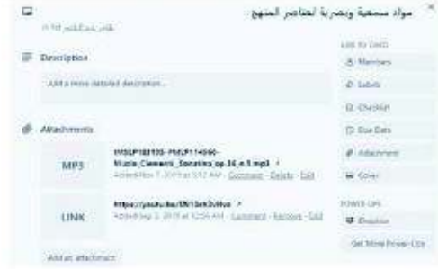
شكل رقم (٦) مواد سمعية وبصرية لعناصر المنهج بالبرتقولييو