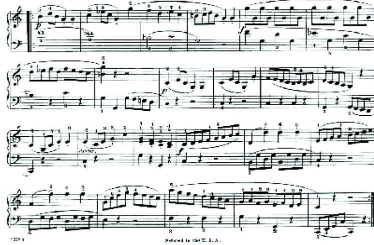
شكل رقم (١٠) ما تم اجرا