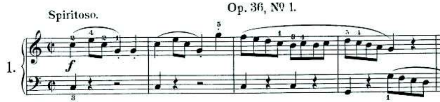
شكل رقم (٢) ما كلف به الطالب بالجلسة الأولى