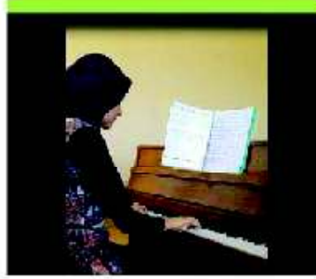
شكل رقم (٤) اتجاز لطلاب

- قامت الباحثة بتوجيه لطلاب الى انها سوف تقوم برفع اتجازهم العرفي بالبورتفوليو الالكتروني الخاص بهم وذلك على صورة فيديو.