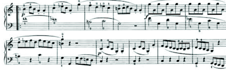
شكل رقم (٩) ما تم انجاز